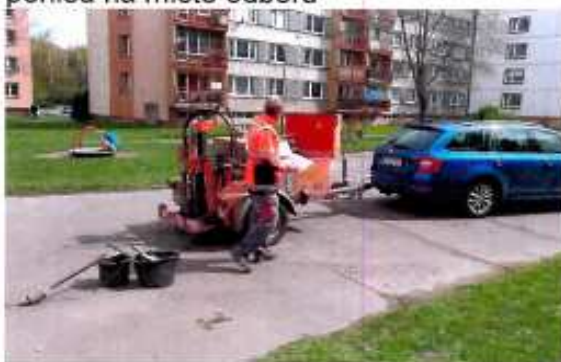
pohled na místo odběru