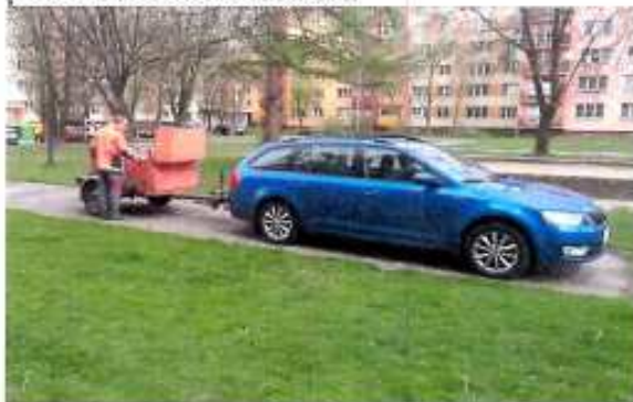
pohled na místo odběru